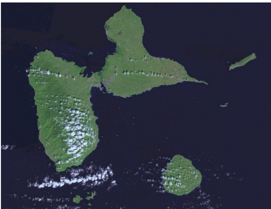
Illustration 1: Photo-satellite