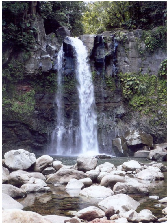
Illustration 4: Chutes du Carbet

Le zouk originellement est une dérive du rythme de la biguine. La percussion du Zouk reprend les temps forts du rythme de la batterie de la biguine. Les origines du zouk sont floues, mais il est souvent admis que c'est le groupe "kassav" qui a en premier lancé ce type de musique. Le plus gros succès du Zouk fut néanmoins Maldon (faux), chanson interprétée par les trois filles de Zouk Machine, parmi lesquelles se trouvait la chanteuse Jane Fostin. Au fil de l'évolution s'est créée une nouvelle variante du zouk, le Zouk-love, plus lent. Les jeunes musiciens guadeloupéens sont actuellement orientés vers le zouk ou zouk-love (Medhy Custos) et vers le Dance-hall ou Raggae-dance hall d'origine jamaïcaine (Admiral T).