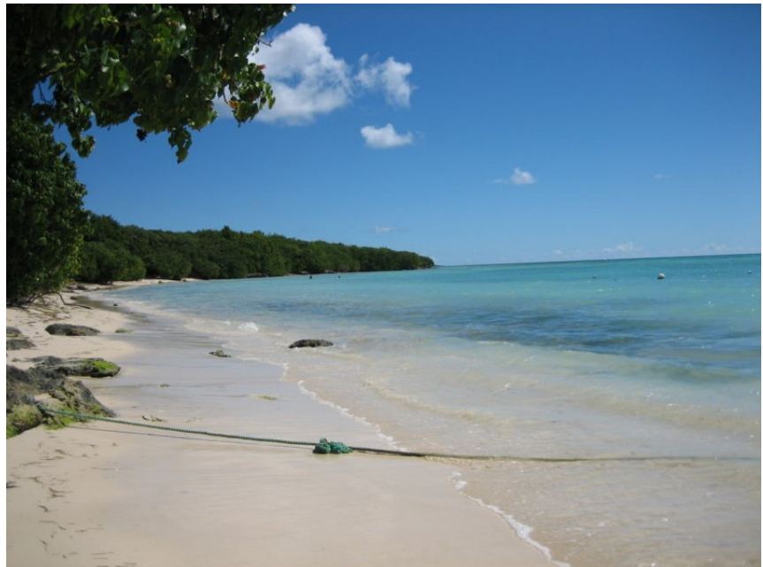
Illustration 3: Plage Grande Terre

Les récifs sont dégradés au moins à 50 % dans les grandes îles, et de nombreux herbiers marins ont également très dégradés. L'Environnement végétal et les paysages restent préservés sur quelques parties de l'île, constituant une ressource majeure pour le tourisme. Ces espaces sont pour partie classés en ZNIEFF (Carte des ZNIZFF et protégés (Carte, pour certaines avec un statut de réserve naturelle guadeloupéenne, dont plusieurs grottes abritant des chiroptères protégés (En savoir plus. Des cartes d'habitats sous-marins (Exemple) permettent d'envisager une meilleure gestion et protection de ces habitats fragiles et des corridors biologiques sous-marins, vulnérables aux pollutions (nitrates, turbidité, pesticides...), aux pressions anthropiques et aux aléas climatiques qui pourraient devenir plus fréquents et aigus dans le contexte du changement climatique global.